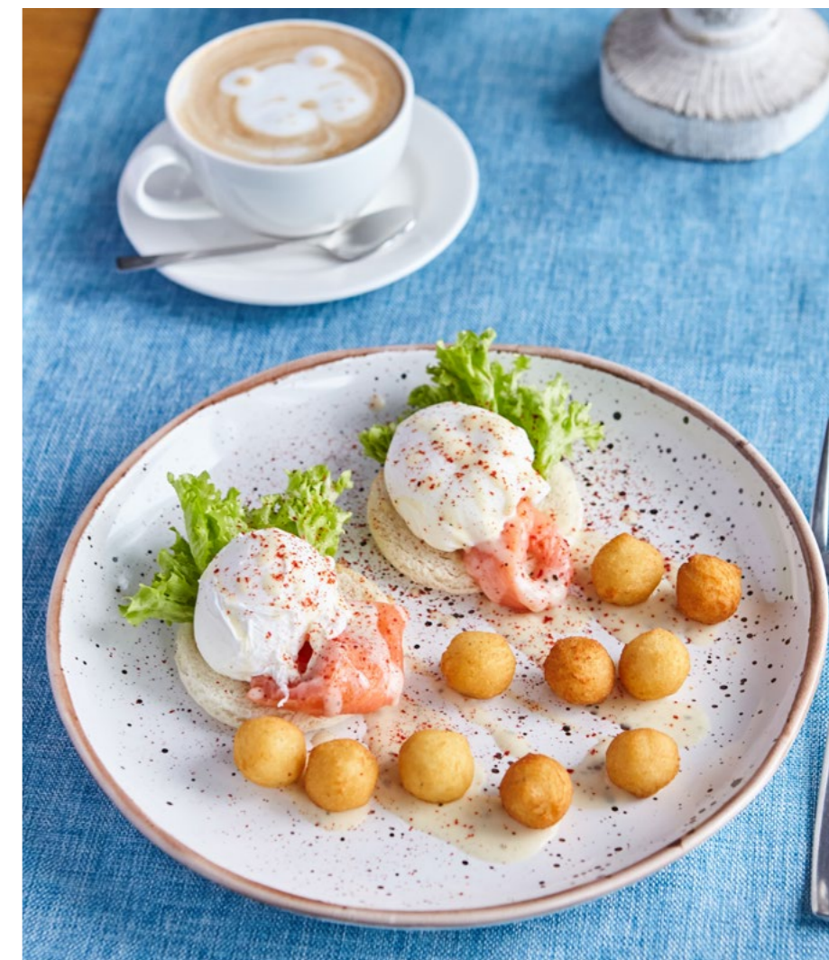
ЯЙЦА "БЕНЕДИКТ" С СЁМГОЙ, КАРТОФЕЛЬНЫМИ КРОКЕТАМИ И СОУСОМ ВАЛЮТЕ