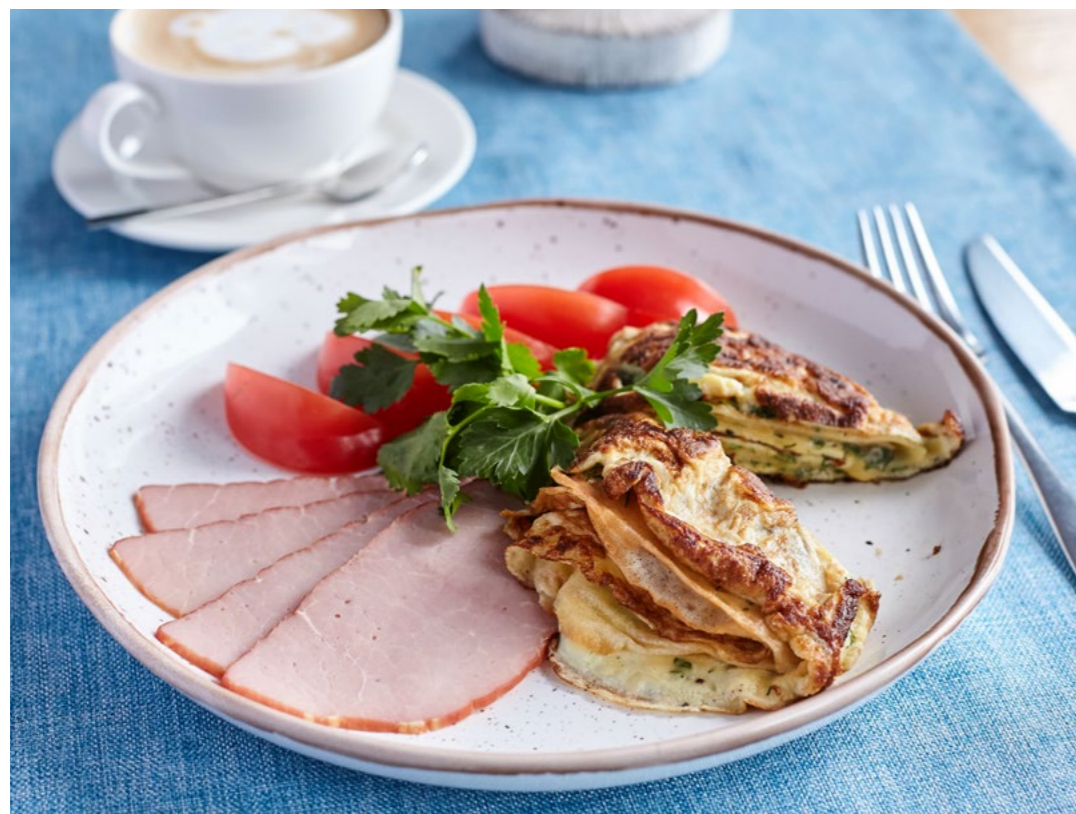
БЛИННЫЙ ОМЛЕТ С ГОВЯДИНОЙ