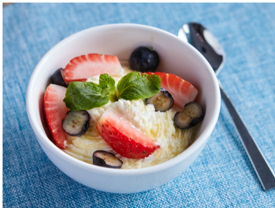
ТВОРОЖНЫЙ КРЕМ-СЫР С ЯГОДАМИ